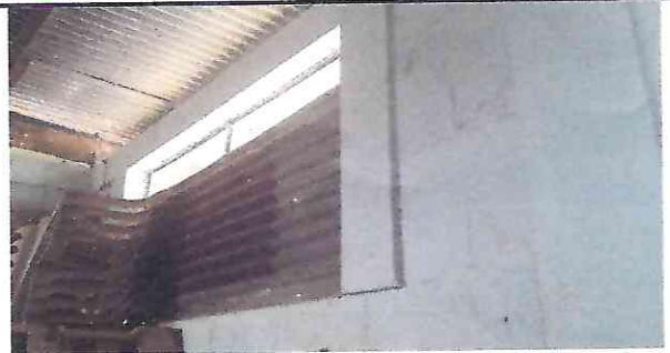
Foto 6: Ventanas sin balcones, permiten que personas ajenas al establecimiento ingresen en horarios nocturnos a robar.

Observación: Si es necesario se pueden agregar hojas adicionales. Identificar el número de hojas.