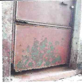
Foto 2: Sustitución de puertas de metal las cuales están en mal estado por el paso del tiempo.