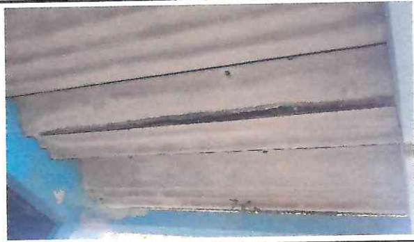
Foto1: Techo de duralita en mal estado por el paso del tiempo, existe ya filtración exagerada en época de lluvia.