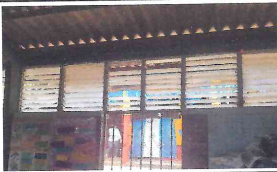
Foto 3: Ventanas en mal estado y deterioradas por el paso del tiempo.